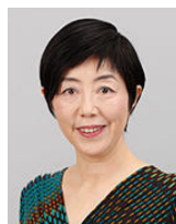
国立情報学研究所 社会共有知研究センター長 一般社団法人 教育のための科学研究所 代表理事・所長